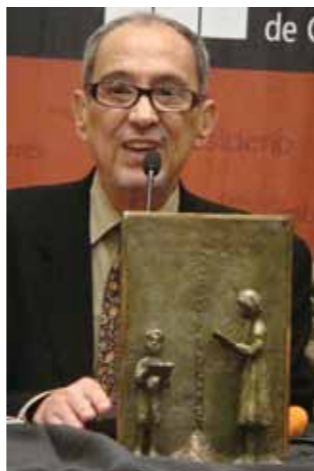
Bartolomeu Campos de Queirós 2008