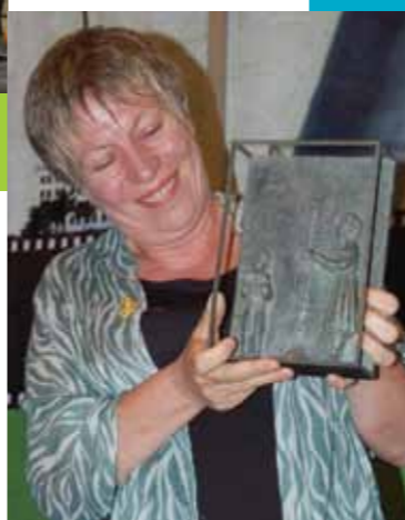
María Teresa Andruetto 2009